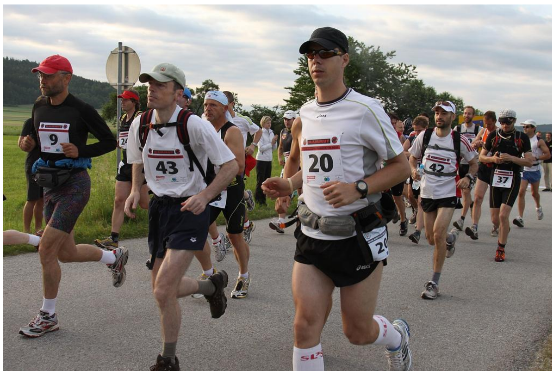
Start Mammut ultramaratonu

Běh a dřina bez hranic - v duchu tohoto hesla se 12.06.2010 odehrál na hranici mezi Českou republikou a Dolním Rakouskem závod Silva Nortica Run. Účastníci si mohli vybrat mezi půlmaratonem, klasickým závodem a Mammut ultramaratonem na vzdálenost více než 85 km. Další možnost nabídl Gemini maraton, kdy si ultramaratonovou trať rozdělili dva běžci, přičemž první běžec musel zvládnout prvních 42 kilometrů a jeho partner druhou půli tratě. Gemini je totiž latinský název pro souhvězdí Blíženců.